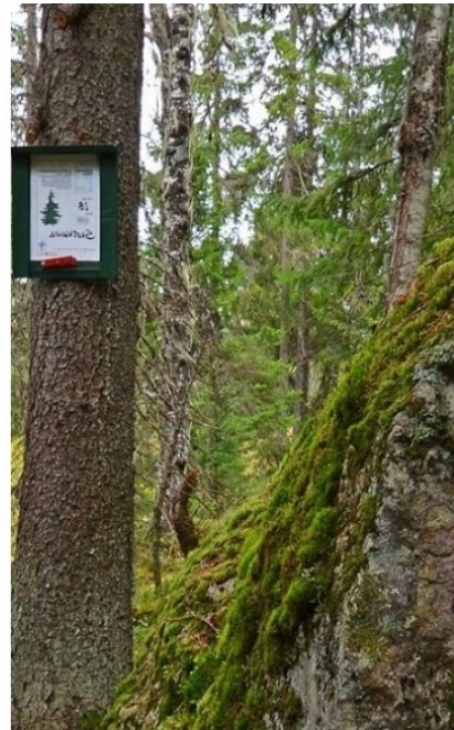
Figur 2: Eksempel på utforming av kjentmannspost