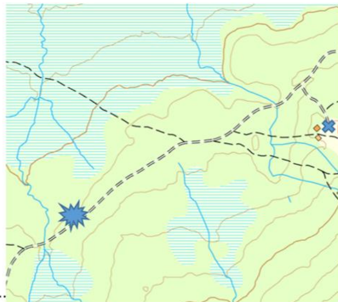
Lokalitet vedhogst – fritidsbolig ved Retsætra.