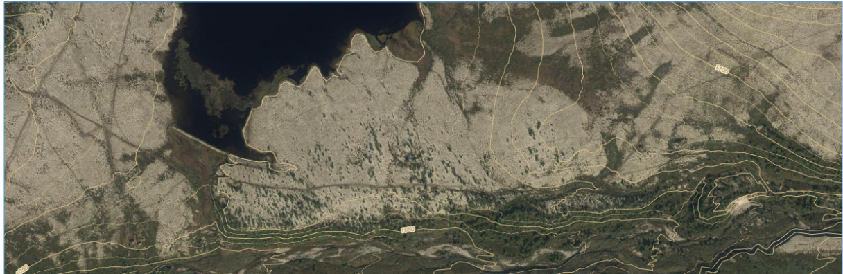
Figur 3. Flybilde med traktorveg fra Ryddølstjønne til Talleraas si måsåbu.

Forvaltningsplanen (s. 100) gir at det her kan gis transport til frakt « av brensel, materialer, utstyr og proviant til buer, hytter og setre. » Søkna den fra Talleraas vurderes derfor til å være i tråd med verneforskriften og forvaltningsplanen.