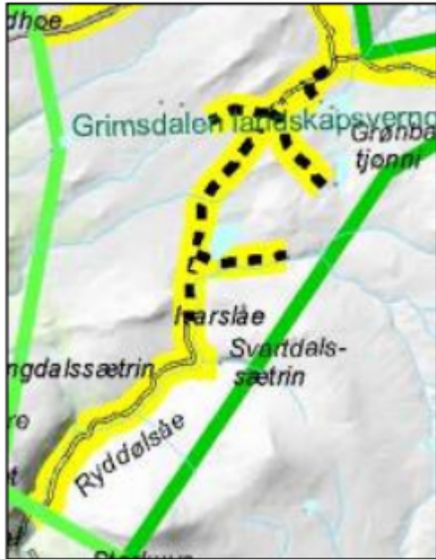
Figur 2. Utsnitt av kart over bilveger og kjøretraseer - sommer, vedlegg 21 til Forvaltningsplan for de store verneområdene i Rondane.