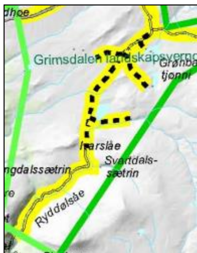
Figur 2. Utsnitt av kart over bilveger og kjøretraseer - sommer, vedlegg 21 til Forvaltningsplan for de store verneområdene i Rondane.

I figur 2 går er det vist godkjente traseer for vegger og kjørespor for transport på barmark.