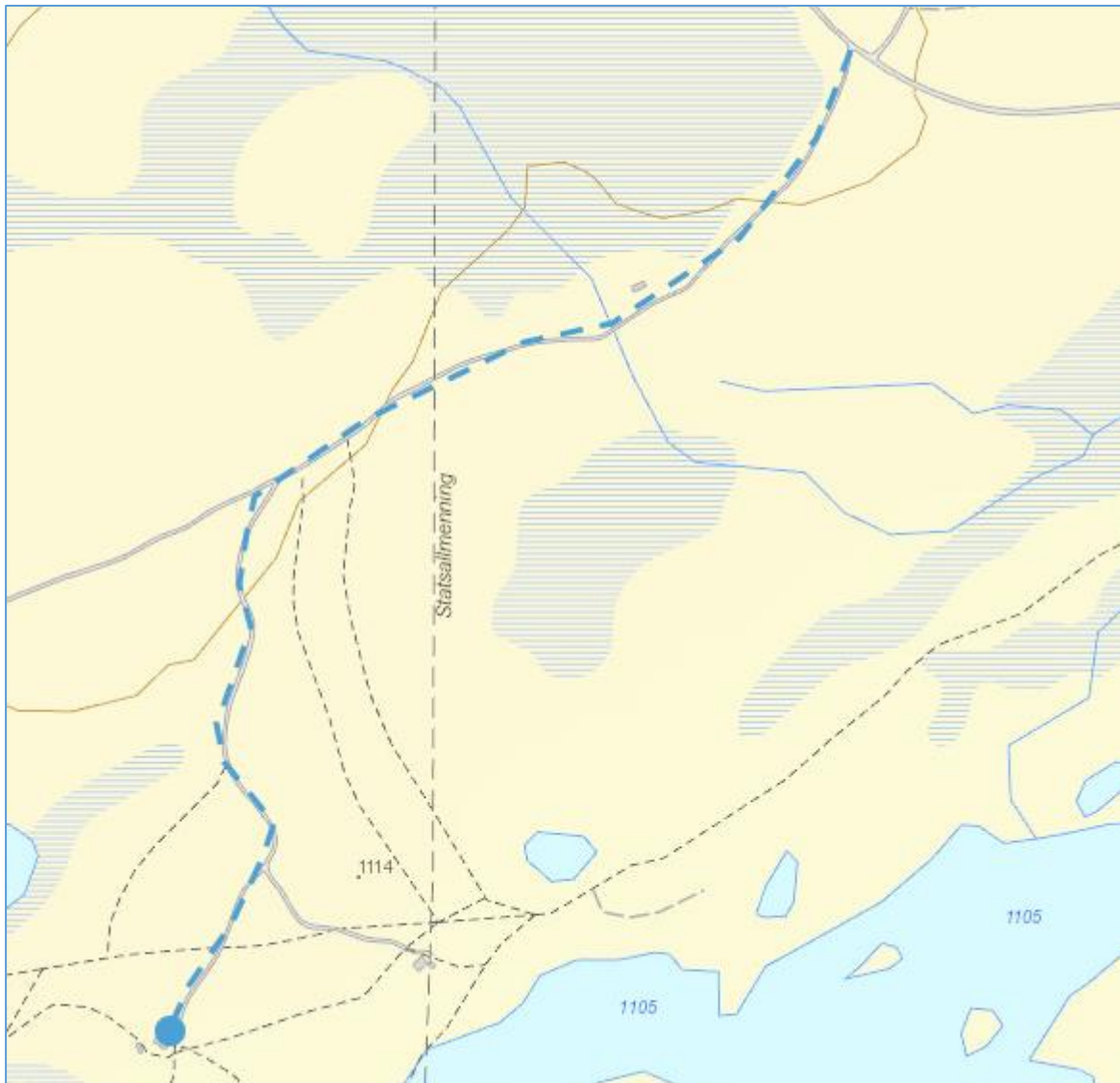
Figur 1. Trase for kjørespor for omsøkte transport og hytta til Kari Hegerholm (blått punkt)