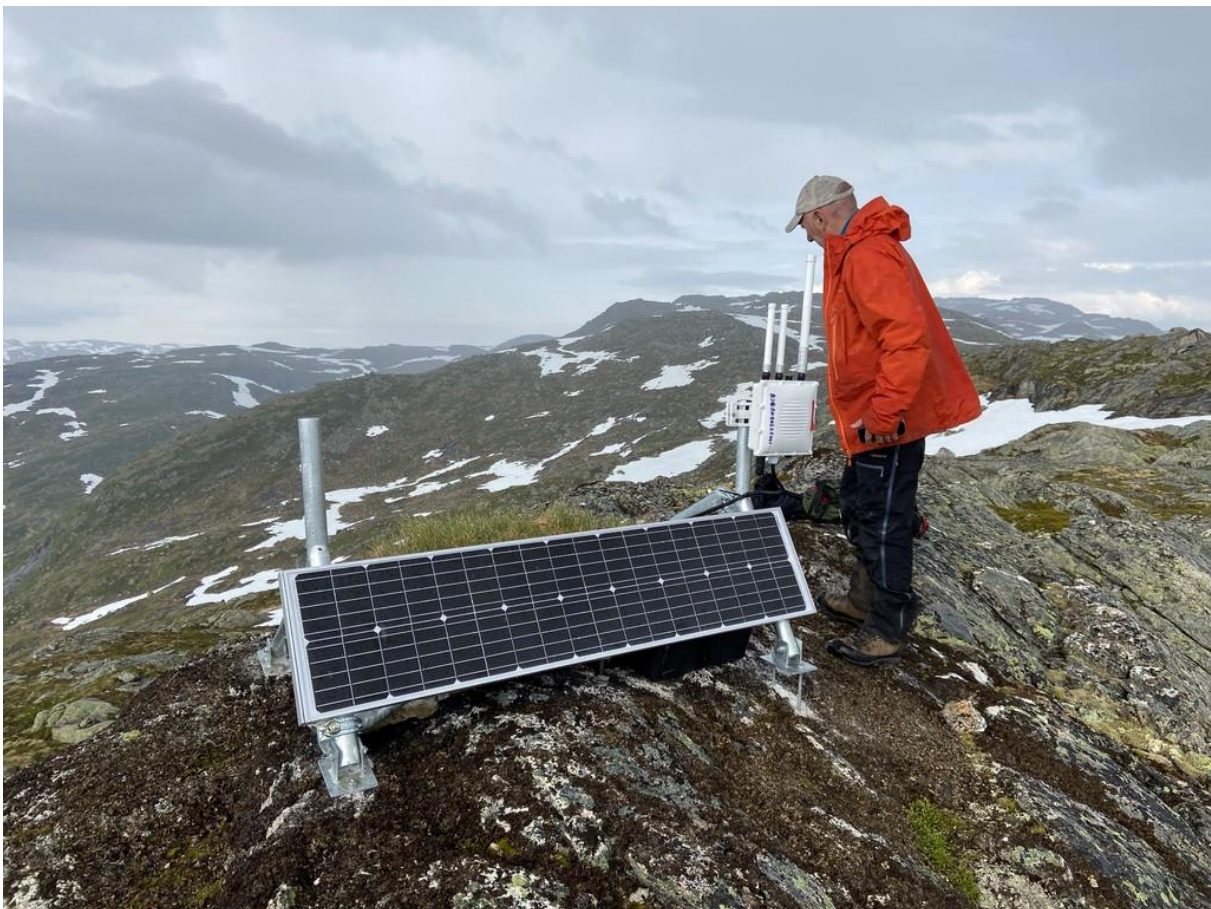
Figur 2 Bilde av basestasjon på Bjørndalseggi.

Stølsheimen verneområdestyre gav løyve til utplassering av basestasjonar for bjøllesystem for sau i møte 27.04.2022 (sak 15/22). Ein av basestasjonane som var omsøkt og gitt løyve til, var ved Kvanndalen på Blåfjellet. Når basestasjonane skulle setjast ut, viste det seg at det denne stasjonen ikkje hadde mobildekning. Ved å flytte plasseringa nord til Øksefjellet, var det dekning på basestasjonen. Det var søkt om ny plassering, men søknaden vart ikkje fanga opp og handsama av verneområdestyret. Basestasjonen vart likevel etablert i juni i 2022, og Vestland Bjøllelag har sendt endringsmelding for denne basestasjonen. Dei har i tillegg sendt rapport som viser at basestasjonane har fungert godt, og vore til stor nytte for tilsyn av sau i dette fjellområdet.