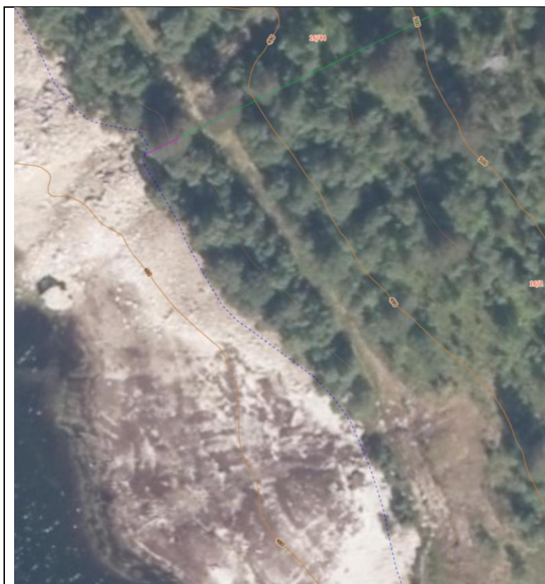
Ortofoto 2014, Bytbekken - Vikaslettet

Sørenden av reguleringsbassenget Gråsjøen ligger om lag 11 km fra bilvei ved Gråsjødemningen. Det er i Trollheimen LVO omsøkt bruk av ATV 6-hjuls i drøye 1 km av starten på vintertraktorveien inn til området Bytbekken/Vikaslettet og videre ned i reguleringsbassenget Gråsjøen. Derfra er det om lag 9 km utenfor verneområdene inn til anløpsområdet for den normale båttransporten innover Gråsjøen.