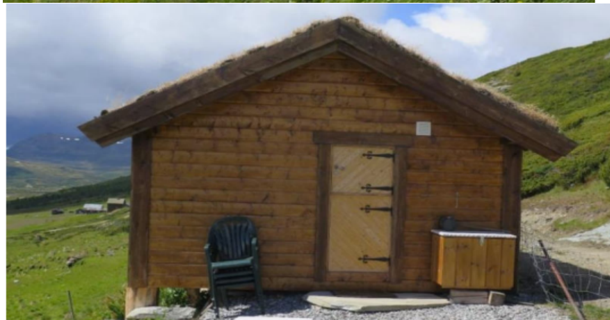
Bildene fra SNO sin rapport viser det oppførte seterhuset på Tverrlisetre

Seterhuset er ikke oppført på eksisterende murer, slik det ble forutsatt i tillatelsen fra 2016. Størrelsen og fargen samsvarer ikke med den gitte tillatelse.