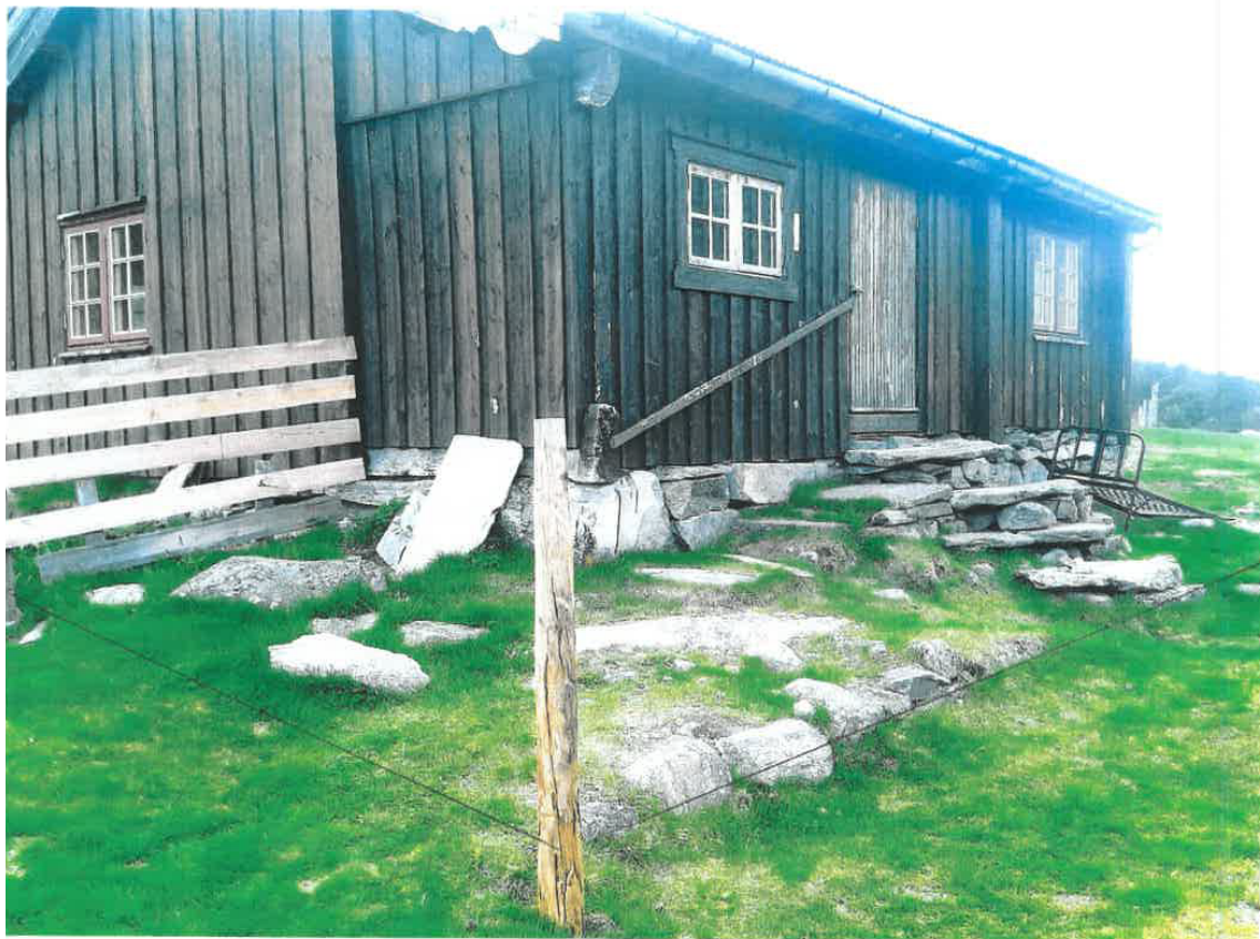
Foto: Seterhuset sett frå aust