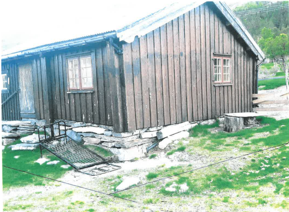
Foto: seterhuset sett frå vest