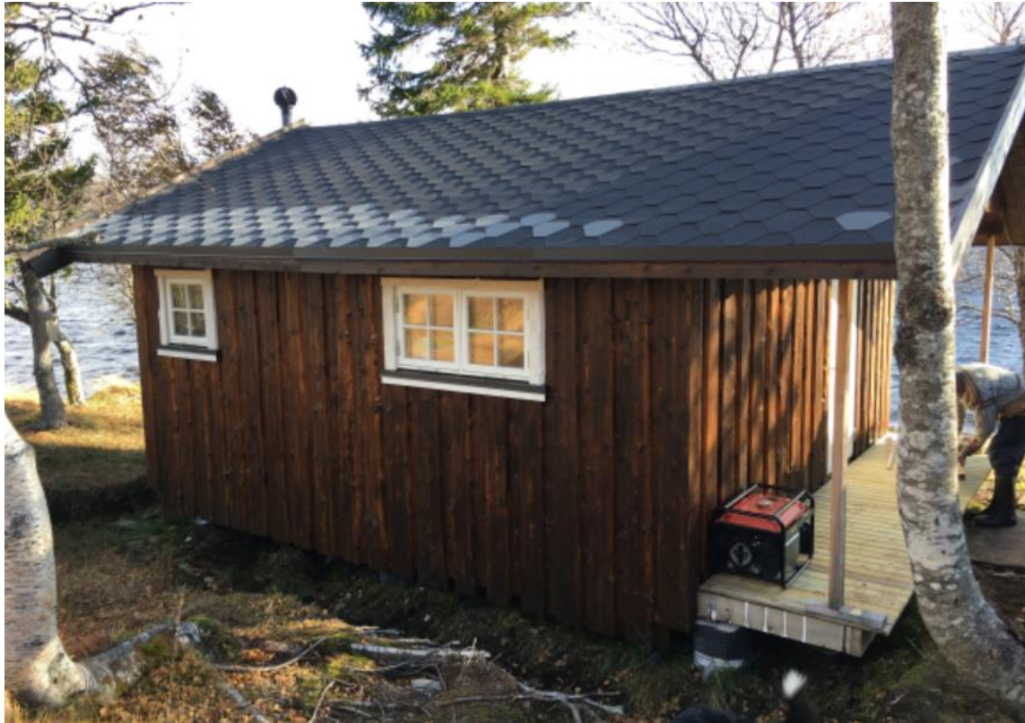
Fig. 3: Bilde av den omsøkte plattingen og det overbygde taket på uthuset/annekset ved hytte Skjækervatnet 11.